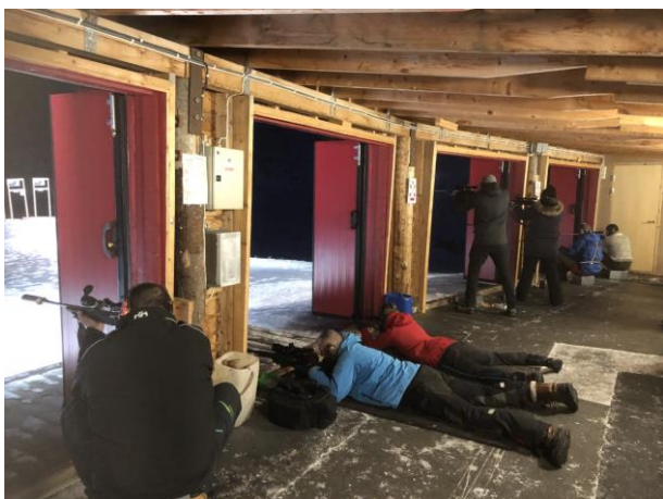
Vinter-felten 16. november