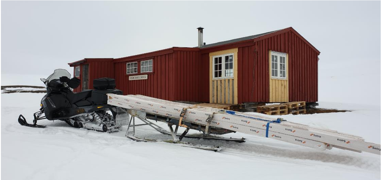
Dugnad i Foxdalen.