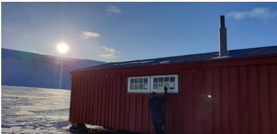
Dugnad i Foxdalen.

På vedlikeholdssiden har det vært gjennomført arbeider på flere av hyttene etter blant annet isbjørnbesøk. Skottehytta hadde fått slått inn vinduer yttergang og indre oppholdsrom, i tillegg til litt ødeleggelse på treverk her og der. Den jobben fikk vi utført allerede før tursesongen startet for de fleste, og i tillegg skifta vi en av ovnene. Skansbukta fikk også innsatt 7-8 nye glassruter og en stor opprydding ble foretatt, blant annet med fjerning av flere bålsteder som var lagd helt inntil hytta. Dette er en gjenganger på flere av hyttene, og vi skal prøve å få brukere av hyttene til å holde seg til lovverket vi er pålagt av staten å følge. På Russekeila ble det gjennomført takreparasjoner. På Anderssenhytta har vi starta med en større renovering, der det er skifta ut fem av ni vinduer, og nytt innvendig panel er satt opp på veggene i oppholdsrom. De resterende vinduer prøver vi å få skifta i løpet av inneværende vinter. Det skal i tillegg byttes ovner, dører og legges furugulv. Ved Anderssenhytta har vi i samarbeid med yrkesskolen, påbegynt arbeider med et tilleggs bygg som skal inneholde mange sengeplasser. Det vil gjøre at vi kan få tjue - tjuetre sengeplasser totalt ved anlegget i Foxdalen. Dette er med tanke på at vi skal kunne ha samlinger med våre ungdoms/juniormedlemmer der ute. På hytta Gåsbu på Vindodden har det blitt bytta ovn.