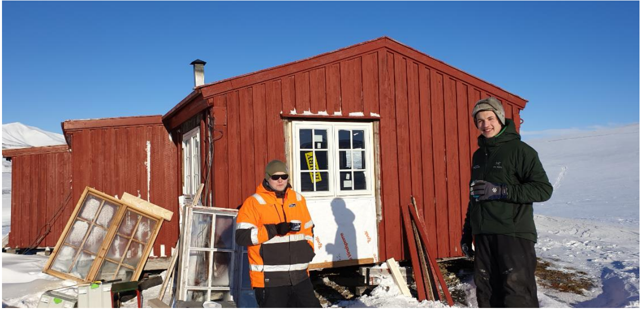
Dugnad i Foxdalen.