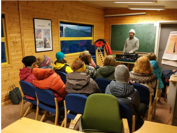
Damekveld 10. oktober