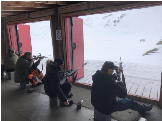
Mai-felten 26. mai

For andre året på rad er det blitt avholdt jaktfeltskyting på skytebanen. Maifelten – 26.mai og Vinterfelten - 16.november. Totalt 81 skyttere deltok på de to stevnene. Det var her mulig å delta i to klasser, åpne sikter og kikkertsikte. Klubbhuset var åpent med servering av kaffe og kake. Det ble også brukt til premieutdeling. Vi opplevde at folk kom tidlig og brukte hele dagen på banen selv etter de hadde skutt. Dette gjorde jaktfeltskytingen til en sosial hendelse samtidig som det er meget god trening til jakt og isbjørnbeskyttelse. Dette er et arrangement vi ønsker å satse mer på i årene framover.