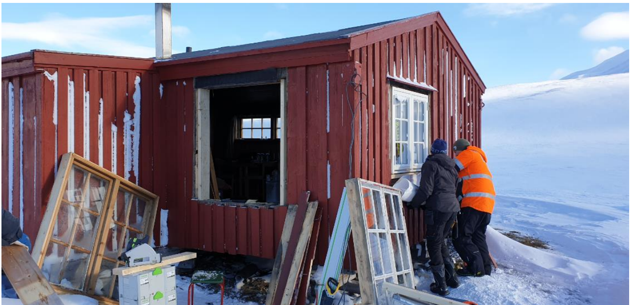
Dugnad i Foxdalen.