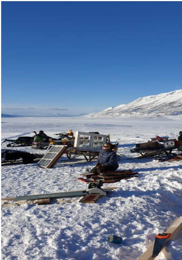
Dugnad i Foxdalen.